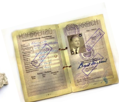
Reisepass von Curd Jürgens