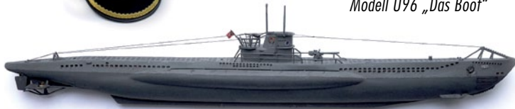
Modell U96 „Das Boot“