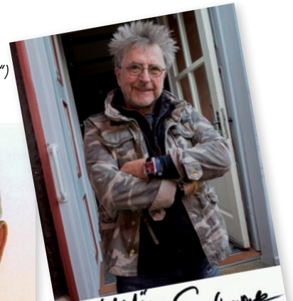
Martin Semmelrogge (Schauspieler „Das Boot“)

Handschriften, Exponate und Zeitzeugen erzählen die Geschichte der Bundesrepublik Deutschland